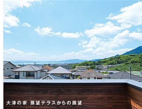
大津の家 展望テラスからの展望

坂道を上った住宅街に並ぶ、うぐいす茶色の外壁と大きな屋根が特徴の家。においや汚れ防止のため壁に囲まれた独立キッチンからは、内窓を通してカウンターへ配膳でき、ダイニングスペースは家族がゆったり団楽できる畳敷きの床座スタイル。リビングには床暖房を完備し、2階に居室と洗面・お風呂などのプライベート空間をまとめた間取りも特徴的です。小屋裏の展望テラスからは琵琶湖が一望でき、イスを並べて花火大会の特等席に。