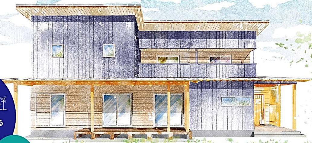
野洲の家 完成イメージ