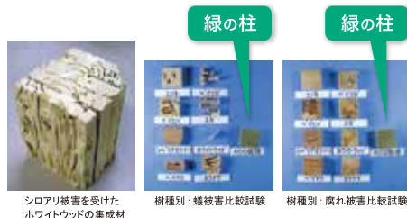
シロアリ被害を受けたホワイトウッドの集成材

一般的に腐れやシロアリに強いとされるヒノキ、ヒバであっても、実際には下の写真のように被害にあいます。住宅用構造材として広く使用されているホワイトウッド(集成材)は一番被害にあっています。優れた耐久性を発揮した「緑の柱」は被害にあっていません。「緑の柱」は「腐れ・シロアリ被害」から家を守り、家を長持ちさせます。