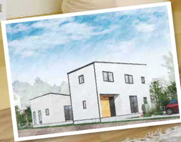
長浜市尊野町の家

35年間、住宅ローンの月々の支払いのために楽しみを我慢したくない。 でも、性能を落として光熱費が高くなつては本末転倒。 お家を建てるときの「わくわく」は当然、 お家を建てた後の人生も「わくわく」できる家づくりを、今こそ。